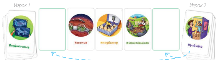
Рис. 2. Карты можно выкладывать только к крайним картам ряда.

Раздайте игрокам по пять карт и две карты положите в центр стола лицом вверх. Игроки ходят по очереди. В свой ход нужно найти среди своих карт такую, которая будет как-то связана с одной из крайних карт, лежащих в ряду на столе. Затем выложить её рядом с этой картой, при этом обязательно объясняя их взаимосвязь. Подкладывать можно только к крайним картам ряда (рис. 2).