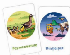
Рис. 3. Эти карты похожи тем, что на них птицы.

Если ходящий игрок предлагает совсем негодную ассоциацию, другие игроки вправе не принять её. В этом случае ходящий должен предложить другой вариант или забрать обратно выложенную карту и пропустить ход.