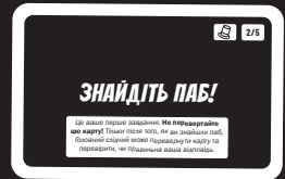
Карта справи, горілиць

Ви не можете просто здогадатися! Ви завжди маєте знайти сцену на мапі міста, яка підтверджує ваше рішення.