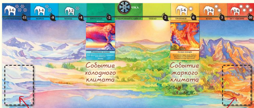
Колода холодного климата