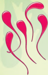
8 липких языков (включая 2 запасных)