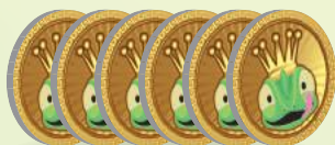
30 жетонов вкусняшек