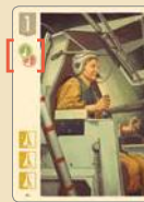
Специалист с 2 разными навыками