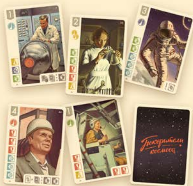
60 карт специалистов