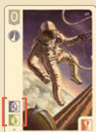
Исходная сложность составляет 2 символа исследований

Первый специалист, которого игрок направляет в пока ещё пустующую ячейку подразделения, имеет максимальную сложность. Нужно набрать все символы исследований, изображённые слева на карте специалиста, чтобы добавить его в подразделение (это делается на третьем шаге).