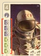
Исходная сложность составляет 6 символов исследований

Начиная со второго специалиста, привлекаемого в подразделение, сложность уменьшается соответственно количеству навыков у тех, кто уже в нём работает.