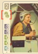
Специалист с 2 одинаковыми навыками