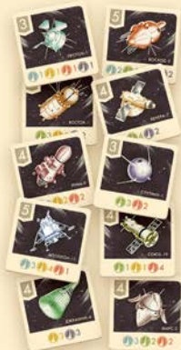
10 карточек проектов