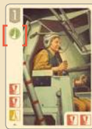
Специалист с 1 навыком

Если специалист имеет навыки в двух разных областях, игрок сам решает, в какое из двух подразделений его определить.