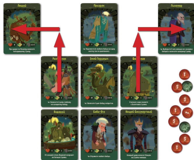
Пример движения карт в первый ход

Если карта закрыта, она не может двигаться.