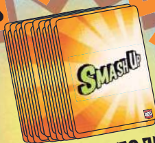
Мореплаватели братьев Гримм!

Затем возьми базы из наборов с выбранными фракциями. Например, если у тебя замес Котиков-Старцев против Стимпанковых Инков, тебе понадобятся базы из «Неизбежного выпуска про Ктулху», «Мимими», «Казачков против помидоров» и «Культурного шока». Если у тебя две коробки «Культурного шока», можешь выдать соперникам одинаковые фракции (например, столкнуть сказки со сказками). Но у каждого игрока в колоде должны быть две разные фракции.