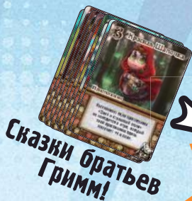
Сказки братьев Гримм!

Каждый игрок замешивает 2 разные фракции по 20 карт в одну колоду из 40 карт и перетасовывает её.