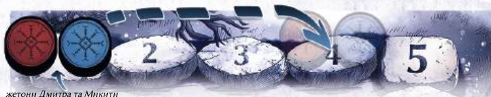
жетони Дмитра та Микити

Дмитро й Микита пересувають свої жетони на планшеті підрахунку очок на 3 поділki вперед.