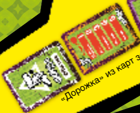
«Дорожка» из карт заданий