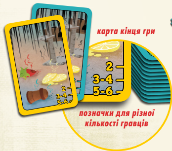
карта кінця гри