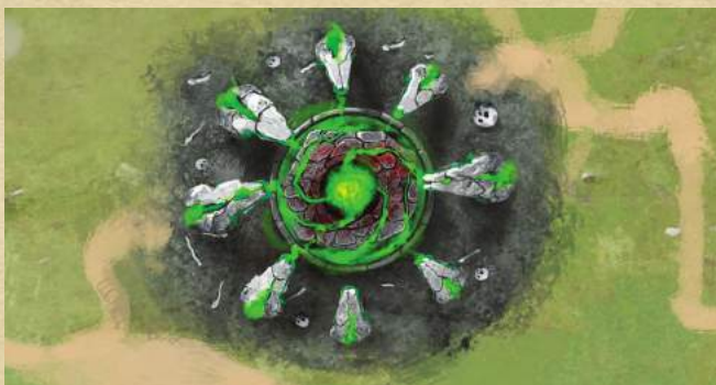
Алтарь проклятий - нанесите 2 урона магией существу противника.