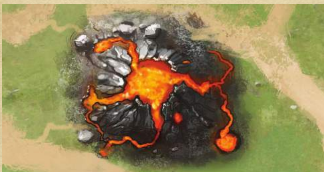
Разлом - 2 урона существу на этой клетке.