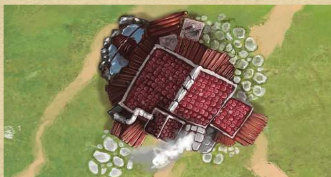
Мастерская - восстановите 2 жизни любому строению.