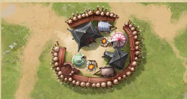
Военный лагерь - добавьте 3 к атаке существу на клетке.