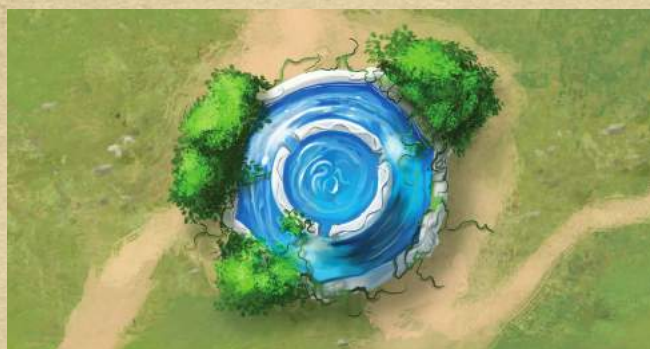
Исцеляющий фонтан - восстановите 2 жизни любому существу.