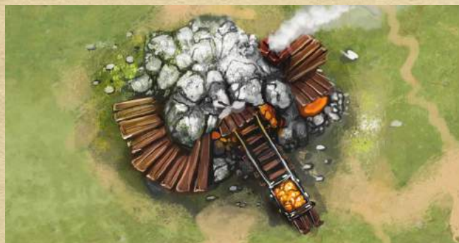
Золотая шахта - получите 2 монеты.