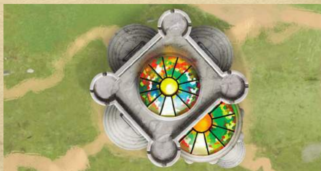
Библиотека - получите 1 ману.