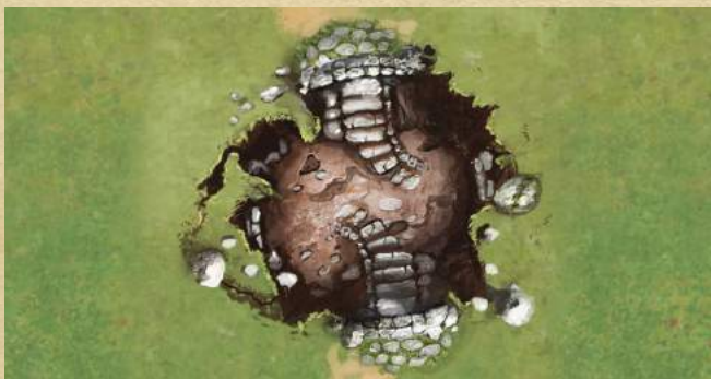
Подземелье - войдите в Подземелье.