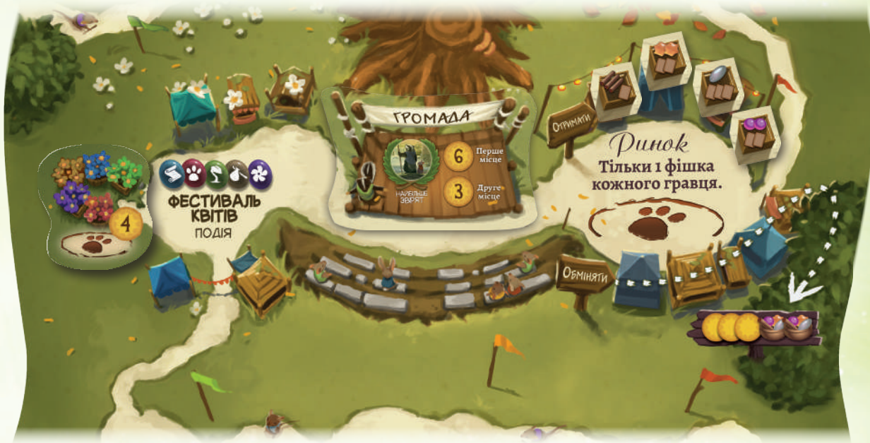
Приклад поля Дзвінограю з фестивалем квітів, стрічкою нагороди та ринком.

Поле Дзвінограю має ринок, а також місця для фестивалю квітів і стрічок нагород.