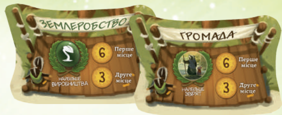
7 СТІЧОК НАГОРОД