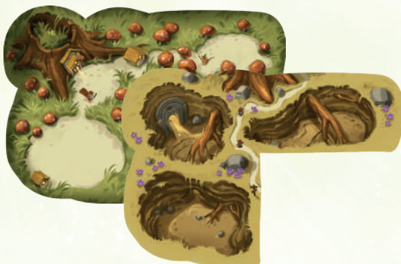
6 ПЛАНШЕТІВ ГРАВЦІВ