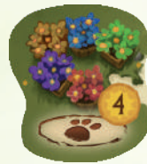
ТАЙЛ ФЕСТИВАЛЮ КВІТІВ