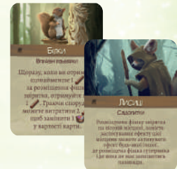
15 КАРТ ЗДІБНОСТЕЙ