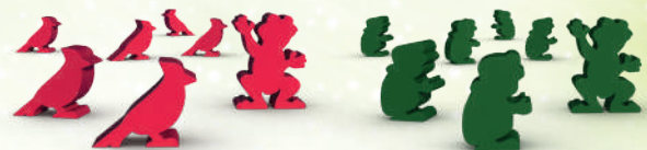
12 ЗВІРЯТ (6 КАРДИНАЛІВ ТА 6 ЖАБ) ТА 2 ЖАБИ-ПОСЛА*