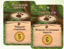
9 КАРТ ОСОБЛИВИХ ПОДІЙ