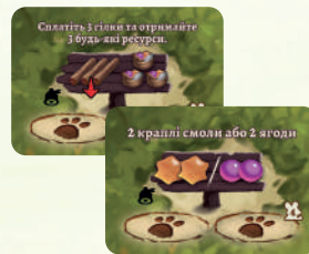
4 КАРТИ ЛІСУ